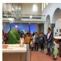
Sankt Franziskus, Wollishofen