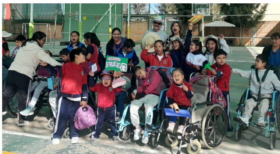
Zwanzig neue Rollstühle stammten von einer christlichen Gemeinschaft aus Lima.