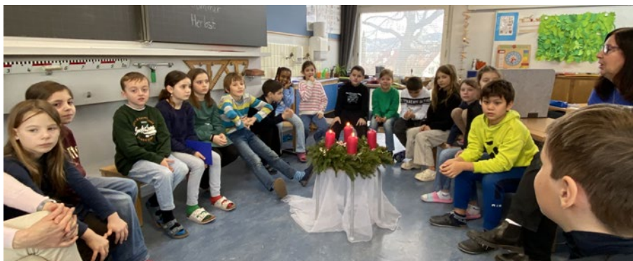
Drittklässler der Primarschule Wetzikon setzen sich für Kinder in Peru ein: 1350 CHF für Weihnachtsgeschenke.