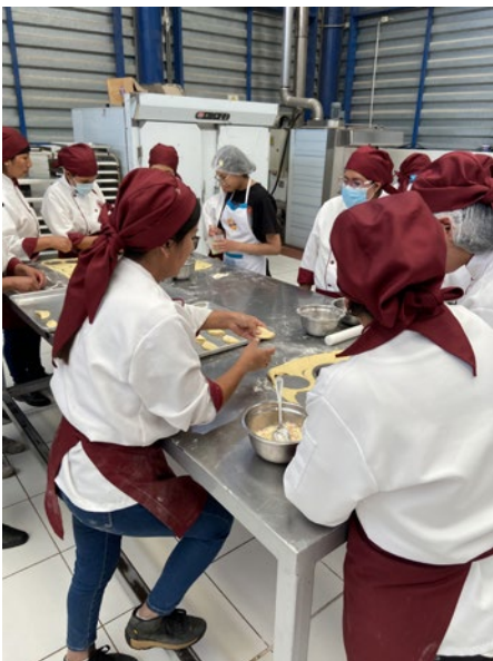
Bäckerei – lernen und Weiterbildung