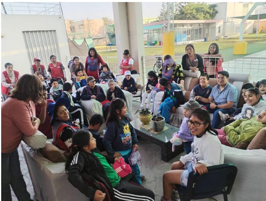
All unsere Kinder in fröhlicher Runde.