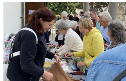
Neu in Altdorf – Gottesdienst und Verkauf von Produkten aus Peru... sowie auch in vielen Pfarreien seit mehr als 30 Jahren, unter anderem in: