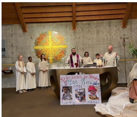
Adventsgottesdienst in Altstetten ZH