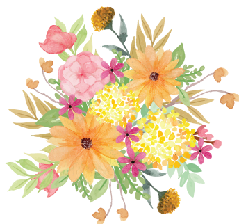
Mit Weihnachtsgeschenken aus Wetzikon