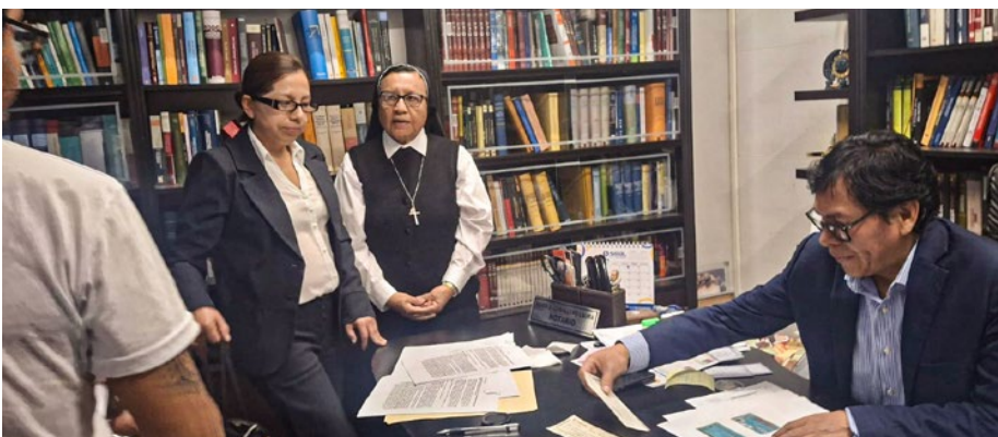
Neuer Zusammenarbeitsvertrag mit Madres Augustinas