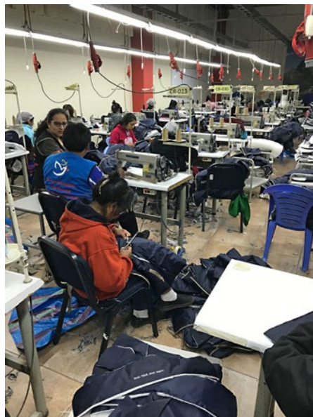
Textilwerkstatt – fertigt nur auf Bestellung