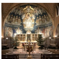
St. Anton ZH