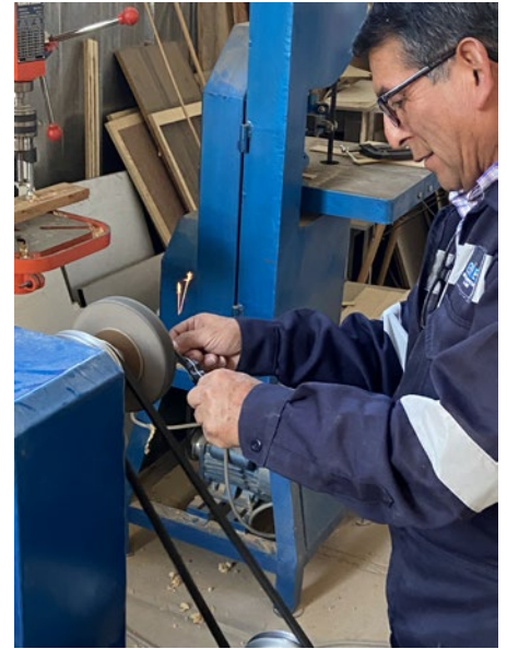
Schreiner-Lehrmeister – in Altocayma. Im Januar 2025 werden diese Schreinerei und auch jene in Socabaya erneuert.